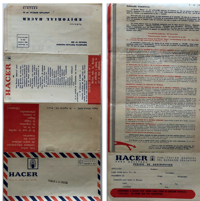
Figura 12. Formato revista-sobre y datos de suscripción (1969)