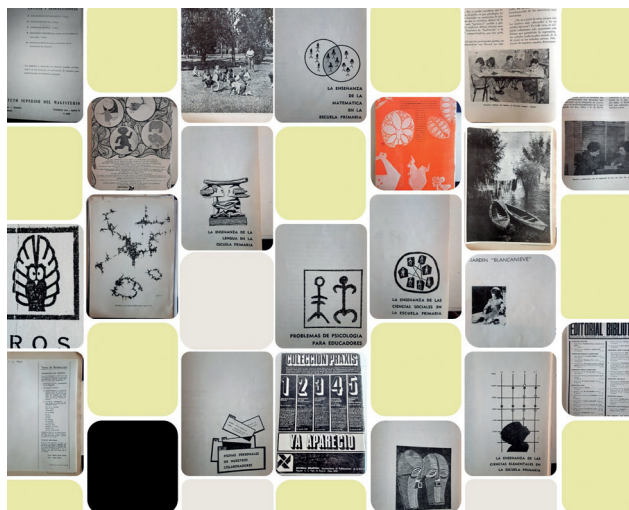
Figura 9. Contratapas, tapas internas y láminas de la revista Hacer , nros. 1 al 15 (1967-1970)

En relación con las portadas internas, cabe analizarlas como una serie coherente y reconocible. Impresas en tinta negra sobre fondo blanco, con trazos de marcado carácter artesanal, las ilustraciones abren secciones temáticas de manera inmediata. En lugar de representar escenas escolares naturalistas —acaso más habitual en la prensa pedagógica de la época—, estas imágenes proponen composiciones abstractas o simbólicas: siluetas, redes de figuras humanas, máscaras, estructuras geométricas o elementos de inspiración etnográfica.