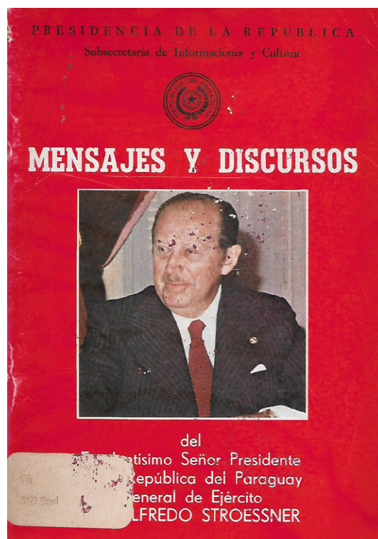
Figura 1. Portada del índice analítico de Mensajes y discursos