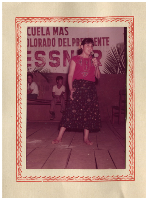
Figura 2. Niña en un acto escolar (al fondo, una propaganda de Stroessner), c. 1980

Finalmente, la categoría “formación docente” sobresale en la década de 1970, comenzando al final de la etapa de afianzamiento de la dictadura y cubriendo la mitad de la etapa del desarrollo del autoritarismo. En particular, el 1º de abril de 1974, Stroessner (1979, Vol. IV) destaca que se ha implementado un “nuevo sistema de formación y especialización docente” (pp. 246-247) que coincide, como lo dice en su discurso de 1979, con “el proceso de desarrollo que vive el país” (p. 884).